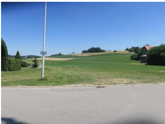
Intensiv-Grünland mit Grünfahrt, Blick nach Osten

Im Nordwesten ragt mit Fl.Nr. 19/9 Tfl. ein Hausgarten ins Gebiet. Hierin stehen kleinere Gehölze und Schnittgehölze. Eine Hainbuchenhecke mit etwa 1,5 m ragt im Westen ins Gebiet. Eine in Form geschnittene bzw. gezogene Platane mit etwa 6 m Höhe steht knapp außerhalb. Auf dem Grundstück steht ein Einfamilienhaus: ein Vollgeschoss mit ausgebautem Dachgeschoss und Satteldach. Im Nordosten befindet sich ein Carport. Am Ostrand steht eine Holzhütte.