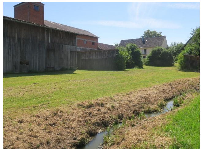
Elsendorfer Bach, Blick nach Westen