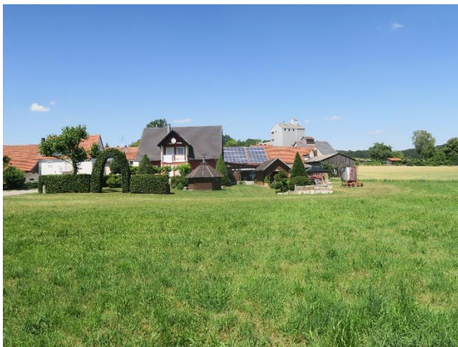
Blick nach Norden über Intensiv-Grünland auf Mitterstetten

Westlich, auf der anderen Seite der Allakofener Straße, steht ein Bushaus. Daneben steht der Maibaum mit Sitzgelegenheiten. Landwirtschaftliche Gebäude und Einfamilienhäuser prägen das Dorfbild.