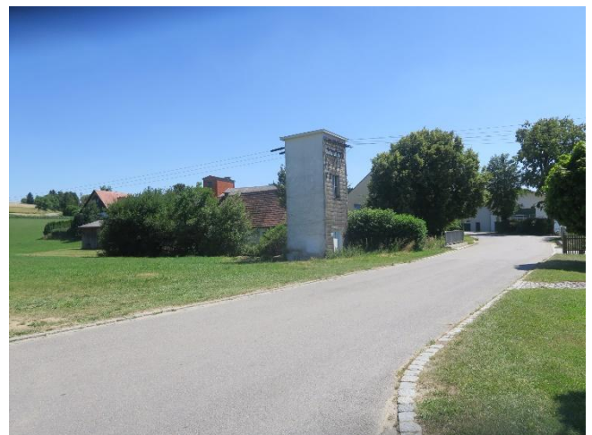
Trafogebäude an der Allakofener Straße, Blick nach Südosten

Im Südwesten des Gebiets steht ein etwa 8 m hohes, begehbare Trafogebäude . Die Freileitungen führen von dort nach Westen über die Allakofener Straße und nach Osten. Neben dem Trafo stehen angrenzend zwei Hainbuchen (StU 64 und 43 cm, jeweils etwa 7 m hoch). Die beiden Bäume stehen am Rand einer kleinen Schnitthecke mit v.a. Rotem Hartriegel und Weißdorn. Eine kleine Fläche ist befestigt. Vom Trafo weg zieht sich zum Bach hin eine Krautflur, die frisch gemäht war. Es wurden jedoch viele liegende Brennnesseln vorgefunden sowie vereinzelter Stumpfbläättriger Ampfer.